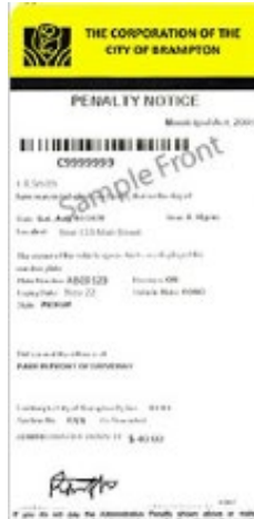
Exemple d'avis de pénalité – automatisé