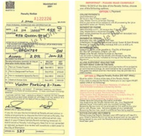
Exemple d'avis de pénalité