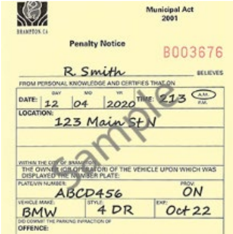
Exemple d'avis de pénalité – manuscrit