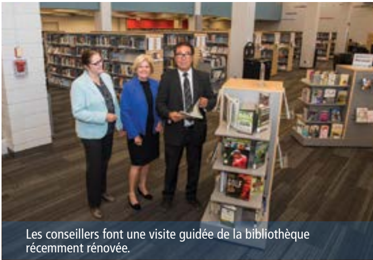
Les conseillers font une visite guidée de la bibliothèque récemment rénovée.