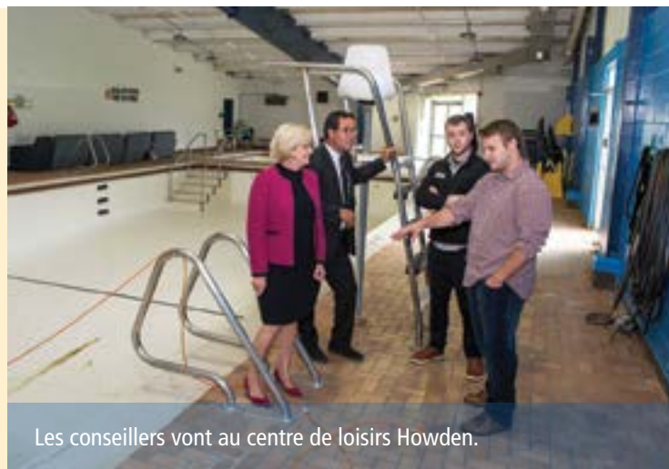
Les conseillers vont au centre de loisirs Howden.

Êtes-vous un aîné ou vivez-vous avec une invalidité permanente? Si c'est le cas, la Ville peut vous aider à couvrir les frais nécessaires pour retenir des services de déneigement. Si vous êtes admissible, vous pouvez recevoir jusqu'à 200 $ pour une parcelle autre qu'une parcelle d'angle, ou 300 $ pour une parcelle d'angle qui a des trottoirs de deux côtés (si ni l'un ni l'autre ne sont déblayés par la Ville). Rendez-vous sur www.brampton.ca/snowgrant pour en savoir plus et découvrir comment présenter une demande.